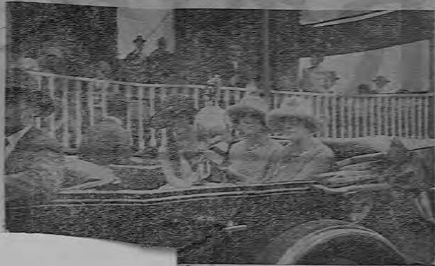
en nombre de la famosa de Casas Registradora Internacional para el equipo vencedor del encuentro Libertad-Gallego.

dor. Juegos Internacionales Gallego-Libertad se exhibió durante el una de las tribunas de la cual desfiló el y por la cual también con denuevo y entusiasmos onces. yó en el primer momento Libertad uniría a sus que en esa mañana se a y fué con gran sentido público que el crítico cuando los players